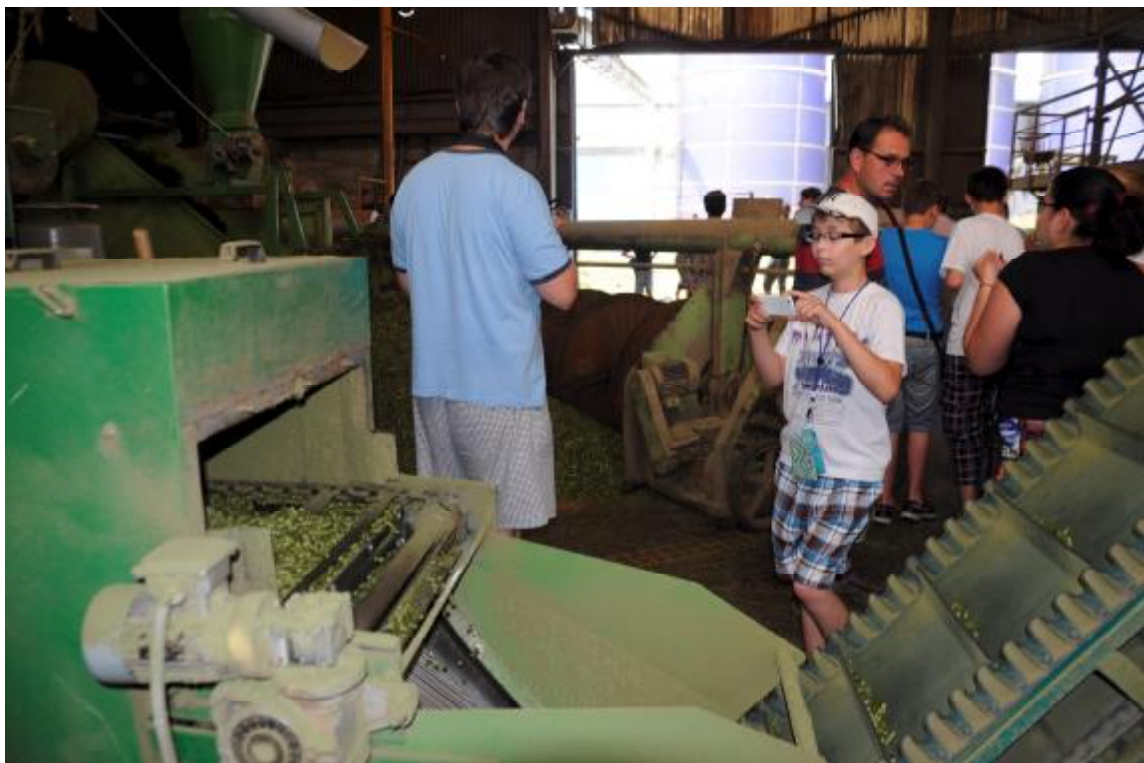
Linka na spracovanie rastlinnej hmoty na granule